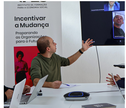
Imagens integradas no Plano Estratégico 2025 da Fundação UNITATE.